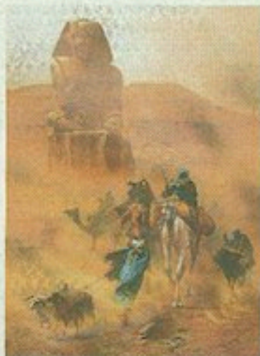
L.H. Fischer, 'Bedoelnen in een zandstorm', rond 1891.